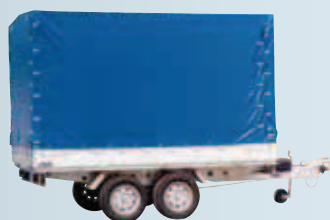
esempio di copertura