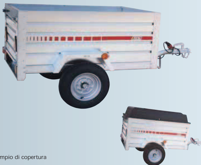
esempio di copertura