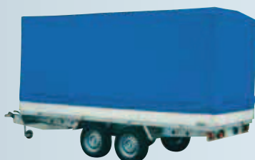
esempio di copertura